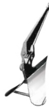
Stainless Steel CQR® Anchor