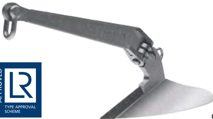
Galvanized CQR® Anchor