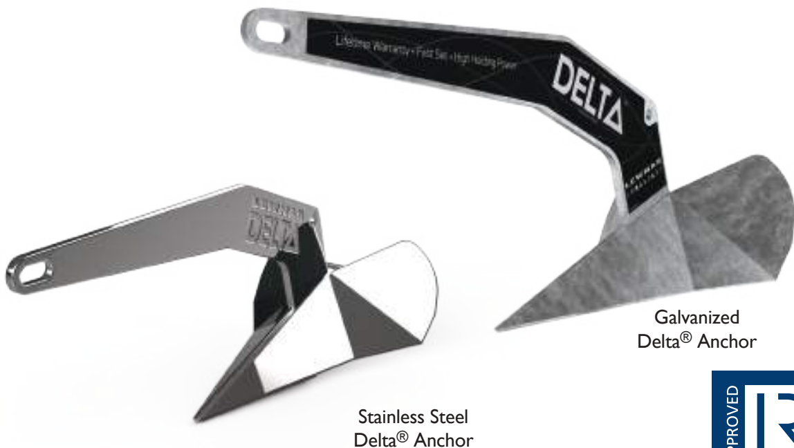
Stainless Steel Delta ® Anchor